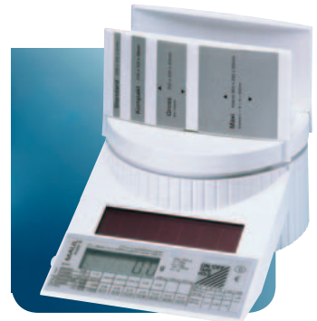
MAUL tronic S